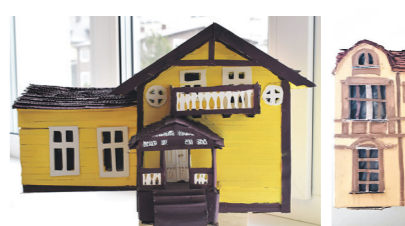
Šveicariško tipo vila. Ignas Drungilas, IIE kl.