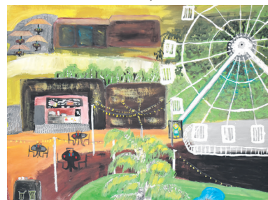
Agnė Cibulskytė, IIIB kl.