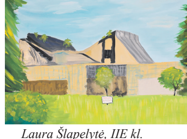
Laura Šlapelytė, IIE kl.