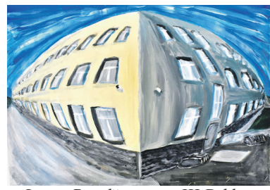
Liepa Puodžiūnaitė, III D kl.