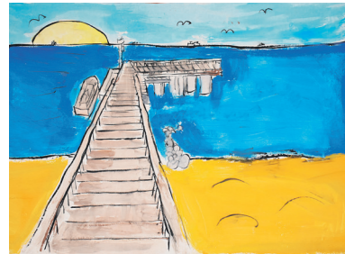
Giedrius Mačenskis, IIB kl.