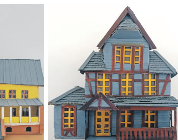
Vila „Sofija“. Gie-drius Mačenskis, IIE kl.