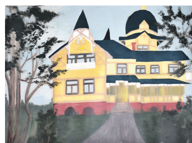
Rusnė Valiukaitė, IIID kl.