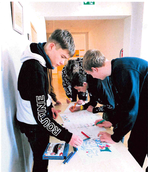
Gimnazistai iš Ukrainos rašo linkėjimus Lietuvai Vasario 16-osios proga.