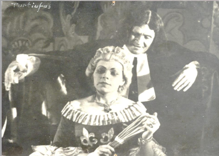
Scenos iš spektaklių „Tartiufas“, pastatytų Lietuvoje

Daugiausia Lietuvos teatruose statytas „Tartiufas“ ir „Skapeno klastos“.