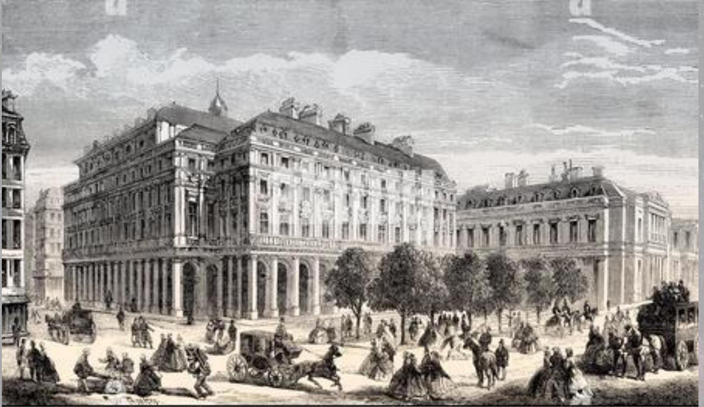
Teatras La Comédie Française, Paryžius, 1863 m.