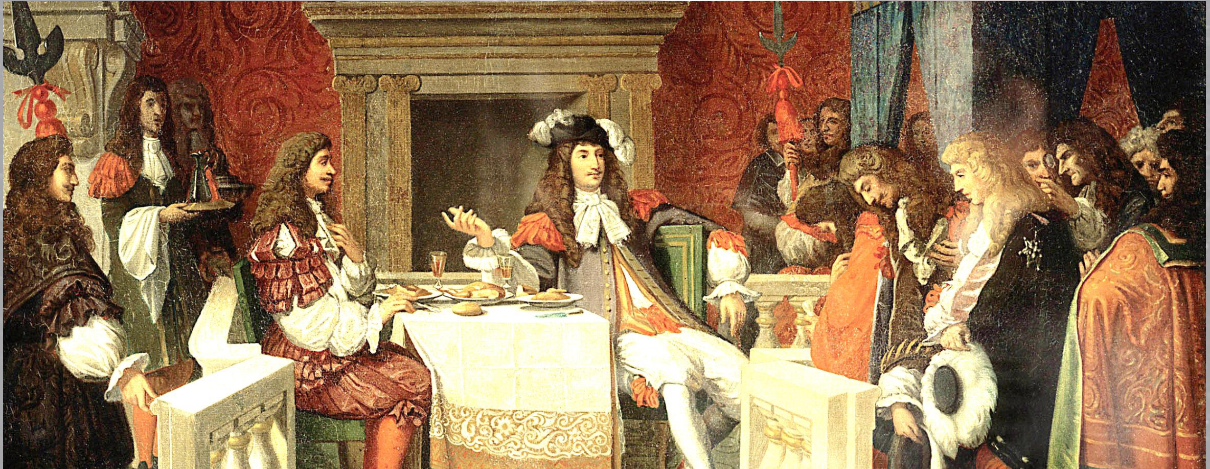
Moljero vakarienė su Liudviku XIV (1857), Auguste'as Dominique'as Ingresas.

Amžininkų liudijimais, Molière'as buvo meistriškas aktorius ir nuovokus administratorius, gebantis deramai surengti spektaklį ir palaikyti sveiką kolektyvo dvasią. Jis buvo vertinamas už išsilavinimą, charizmą, taktiškumą ir mokėjimą elgtis visuomenėje. Molière'o sugrįžimą į Paryžių 1658-aisiais lydėjo triumfas: vos parodęs čia savo pirmą spektaklį, dramaturgas gavo karaliaus Liudviko XIV leidimą savo trupei naudotis „Petit-Bourbon“ sale. Nuo 1661 m. savo pjeses statė „Palais-Royal“ rūmuose, kuriems, tiesa, perstatytiems, buvo lemta tapti teatro „La Comédie Française“ pastatu.